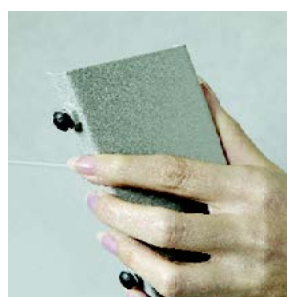
Emboîter le bac sur le piètement