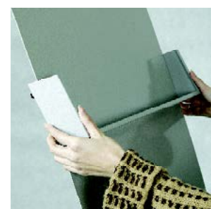
Le positionner à la hauteur désirée